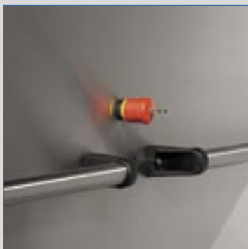
Przycisk awaryjnego zatrzymania