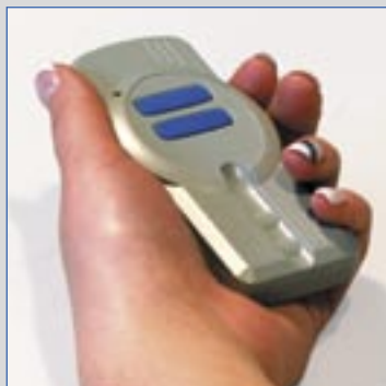
Opcjonalny pilot sterowania zdalnego